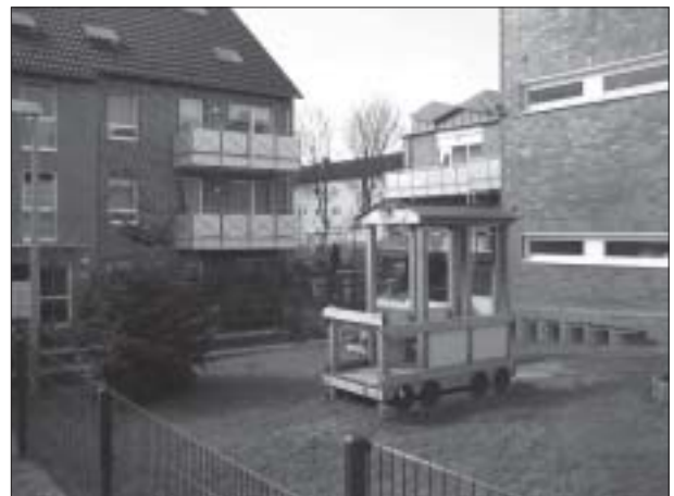
Abb. 3: Innenhof des Projekts „Wohnen auf dem Hanganey“

Auch die Gruppe in Herne hat einen längeren Suchprozess hinter sich. In einer Kerngruppe von sechs Personen ging man dann 2005 auf die bestehende Genossenschaft zu. In langen Verhandlungen wurden die Details eines möglichen Projektes besprochen. Nachdem klar war, dass das Projekt aus Kostengründen mehr als doppelt so groß werden muss wie beabsichtigt, bestand die besondere Herausforderung darin, mitten im Prozess neue Mitglieder zu werben und in die Gruppe zu integrieren. Als Rahmen für die Bewohnerstruktur diente eine Unterteilung in drei Altersklassen (unter 40, 40-60, über 60 Jahre alt), kombiniert mit zusätzlichen Kriterien (z. B. Vorhandensein von Kindern in einem Haushalt). Die Gruppe musste nun insbesondere um junge Familien erweitert werden, um das Konzept eines Mehrgenerationenprojektes umzusetzen.