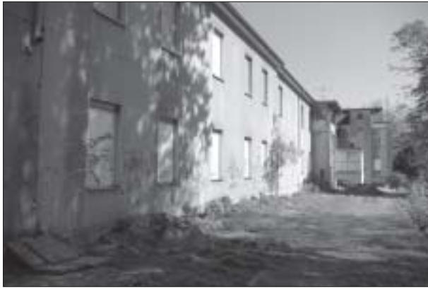
Abb. 2: Gebäude des Projekts „buntStift“ vor der Baumaßnahme

Auch das Projekt in Herne hat seinen Ausgangspunkt in einer Kerngruppe. Sich abzeichnende Planungen der Stadt zur Neugestaltung des Umfeldes der früheren Flottmann-Hallen gaben für eine Gruppe lokaler Umweltaktivisten den Ausschlag, eine latent vorhandene Idee für eine alternative Wohnform zu konkretisieren. Die treibenden Kräfte waren dabei Menschen nach Ausklingen der Familienphase.